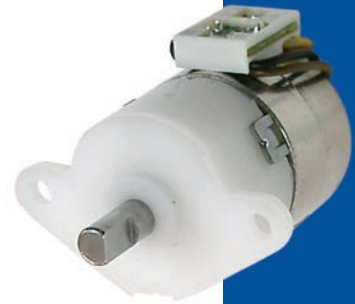
PG Type Motors